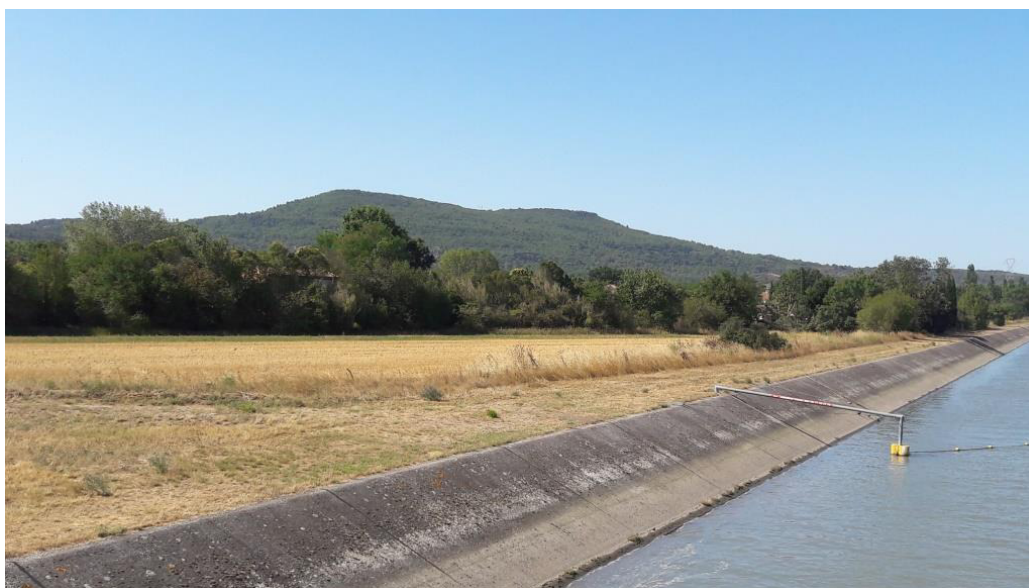
Champ de blé après moisson

Réorienter la politique de l'habitat vers la densification de l'existant (Grande Terre, Pont Royal, Coup Perdu), le développement de nouvelles formes d'habitat et la réhabilitation des logements de centre bourg, plutôt que vers la multiplication des lotissements consommateurs de terres cultivables.