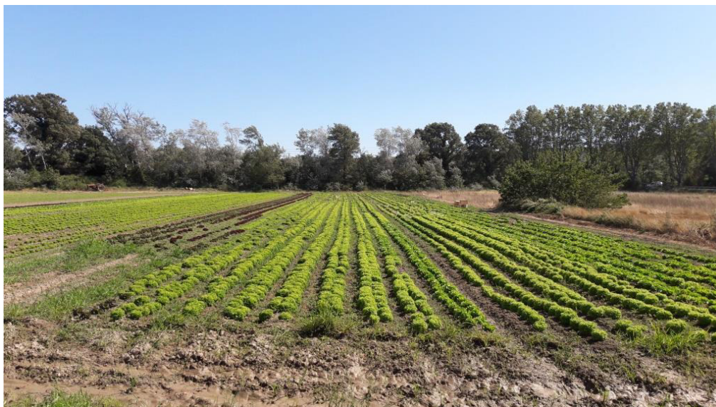
Champ de salades

Aide au développement d'une agriculture de proximité bio.